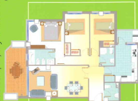
PLANTA CUARTA, VIVIENDA A, BLOQUE 2

áticos, pisos de 1, 2, 3 y 4 dormitorios [82 viviendas]