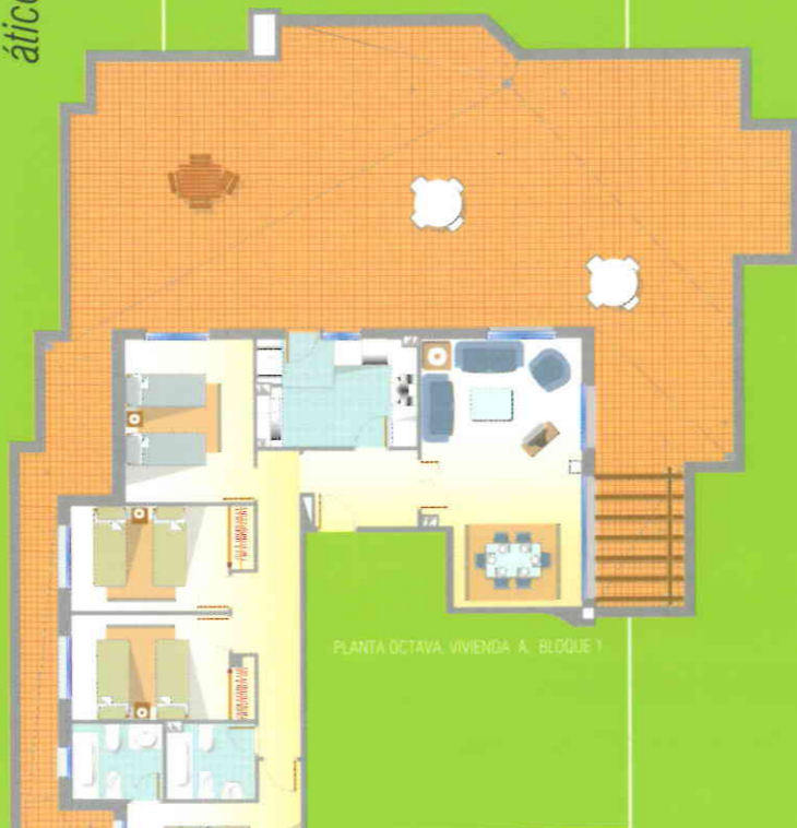
PLANTA OCTAVA, VIVIENDA A, BLOQUE 1