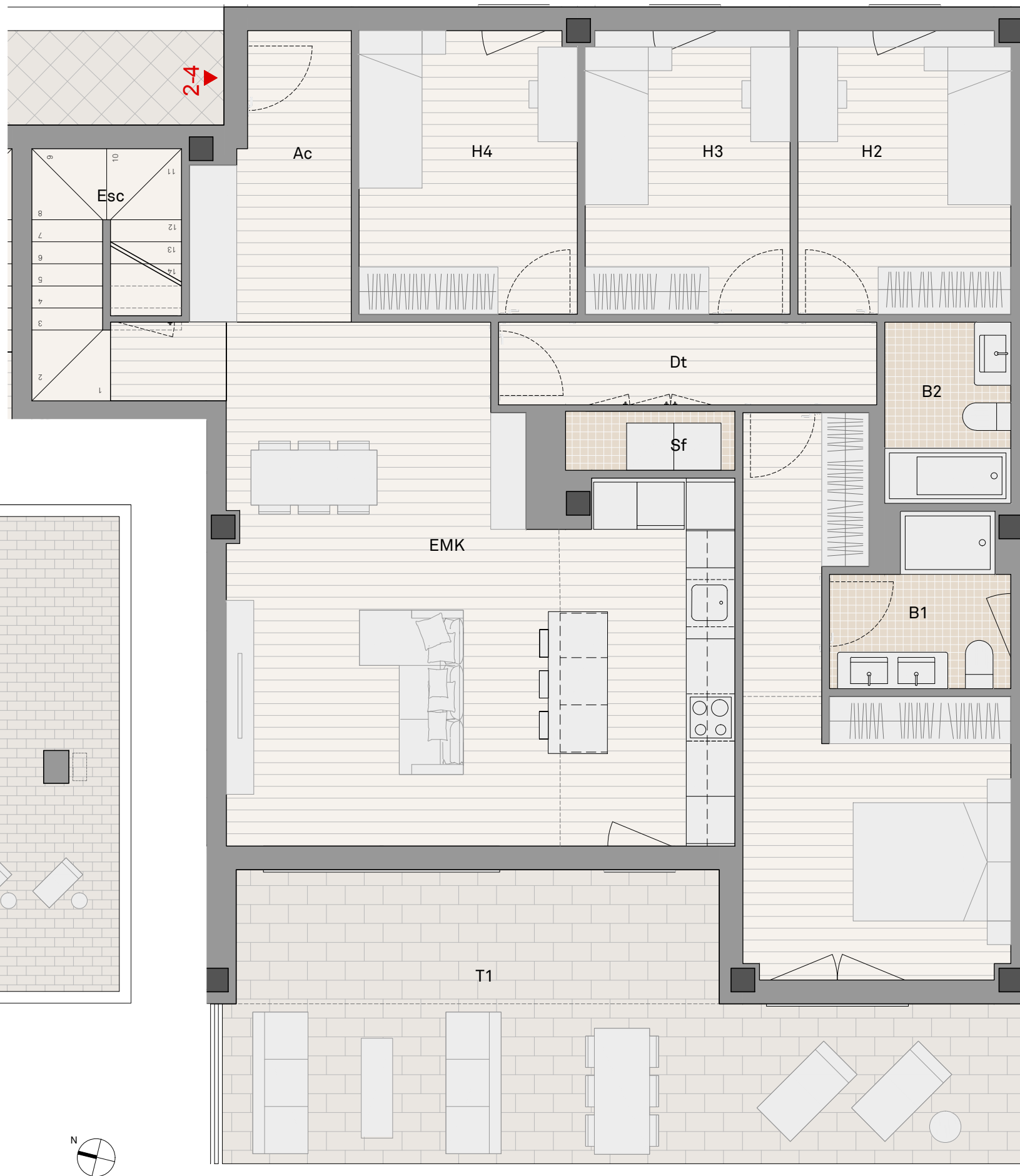
PLANTA e: 1/60